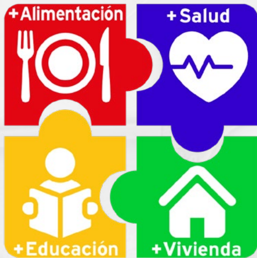
4 Ejes de Atención